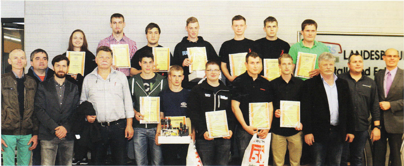
Die Teilnehmer des Bundesberufsschulwettbewerbs der Baumaschinentechniker mit den Juroren.